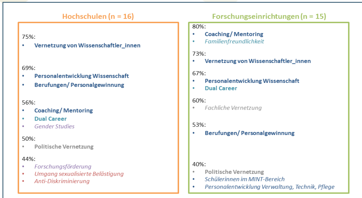
Abb. 2: Gegenüberstellung der Top Ten-Themen (farbliche Markierung entspricht dem jeweiligen Themenfeld; kursive Markierung zeigt an, dass ein Thema nur bei einer Gruppe unter den Top Ten ist)

„Familienfreundlichkeit“ war dagegen nur bei den Gleichstellungsakteur_innen an Instituten und Zentren der Forschungseinrichtungen ein Top Ten-Austauschthema, „Dual Career“ traf bei beiden Gruppen auf mittleres Interesse.