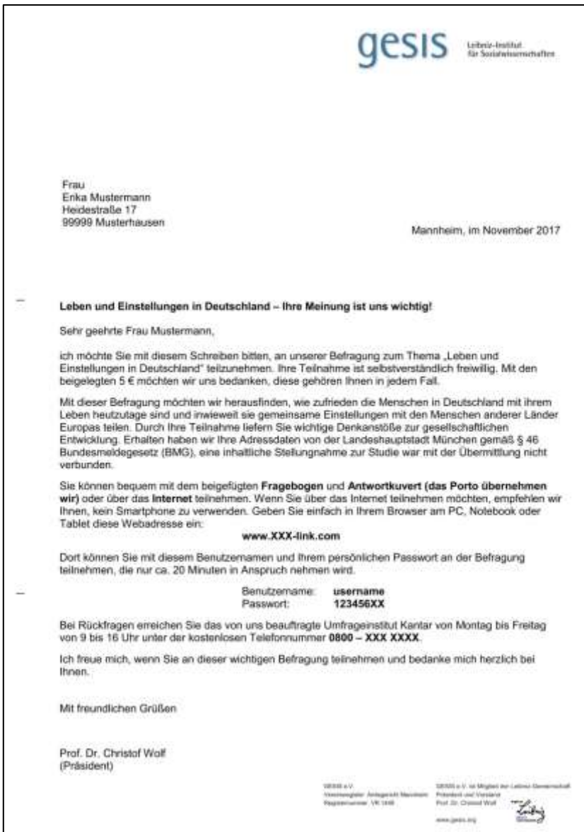
Abbildung 2: Beispiel eines Zielpersonen-Anschreibens im Rahmen einer selbst-administrierten Mixed-Mode-Studie (schriftliche Befragung und Online-Befragung)

Abschließend möchten wir betonen, dass sowohl unsere Empfehlungen als auch die beiden Beispiele lediglich Vorschläge darstellen, die aus unserer Sicht zweckmäßig sind, um die Teilnahmebereitschaft auf Seiten der Zielpersonen zu erhöhen. Jedoch ist es für die Erstellung eines eigenen Anschreibens zwingend erforderlich, die jeweiligen Spezifika der eigenen Untersuchung (wie z. B. die interessierende Zielpopulation oder die an der Durchführung der Befragung beteiligten Akteure) zu bedenken. Vor diesem Hintergrund ist letztlich abzuwägen, welche unserer Empfehlungen für das Anschreiben Berücksichtigung finden könnten.