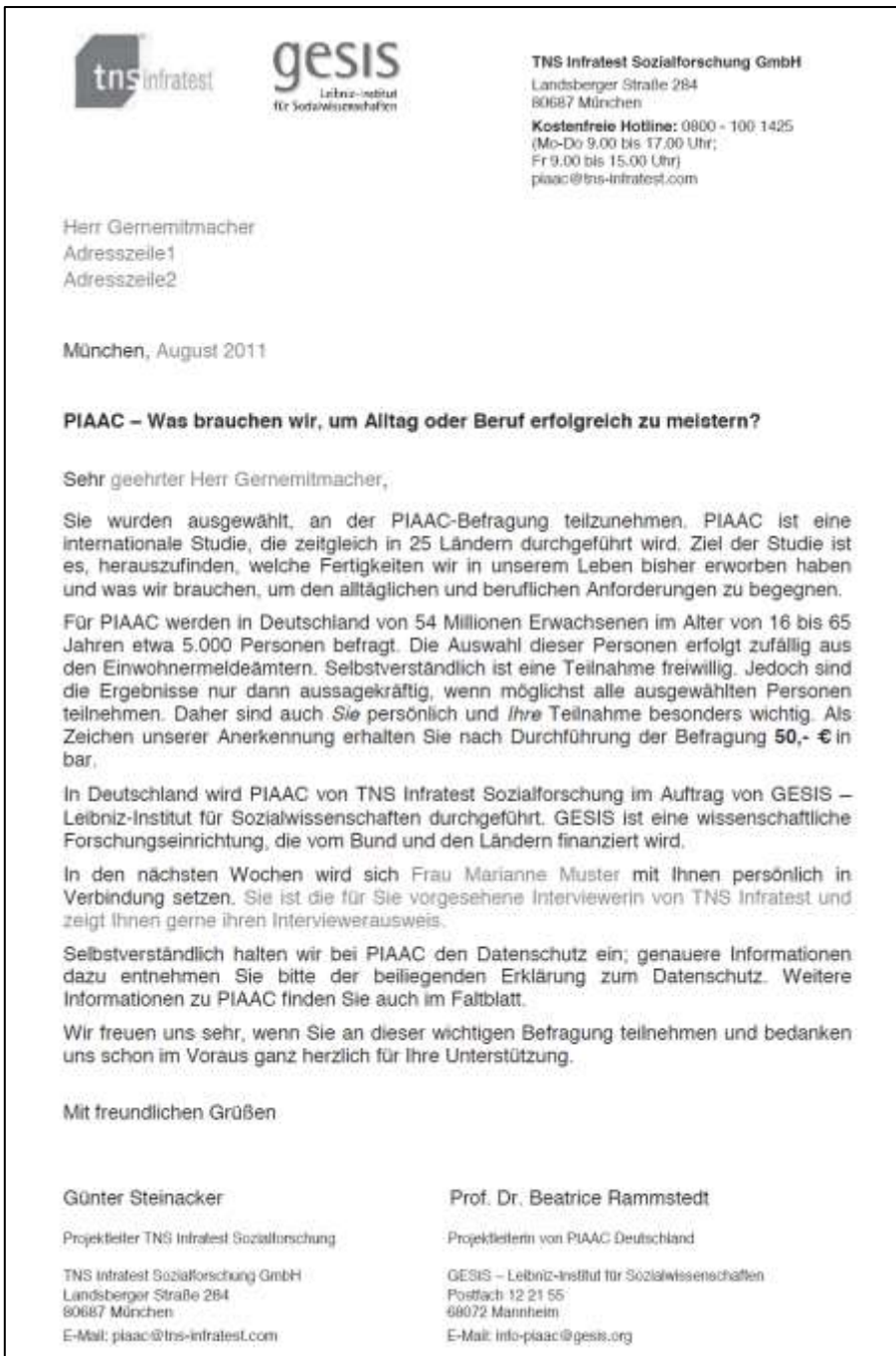
Abbildung 1: Beispiel eines Zielpersonen-Anschreibens im Rahmen einer persönlich-mündlichen Befragung (Nationale Teilstudie des Programme for the International Assessment of Adult Competencies, PIAAC; Zabal et al. 2014)

Beim zweiten Anschreiben handelt es sich um ein Beispiel für eine selbst-administrierte Befragung, in deren Rahmen die Zielpersonen die Möglichkeit haben, einen Papierfragebogen auszufüllen oder über das Internet teilzunehmen. Hieran wird deutlich, dass die Unterschiede des Zielpersonen-Anschreibens für eine rein schriftliche Befragung und für eine Online-Befragung mit postalischer Rekrutierung gering ausfallen und sich lediglich in der Instruktion der Zielperson für die Teilnahme an der Befragung unterscheiden.